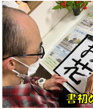
書初めをしました