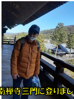
南禅寺三門に登りました