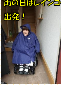
雨の日はレインコートで出発!