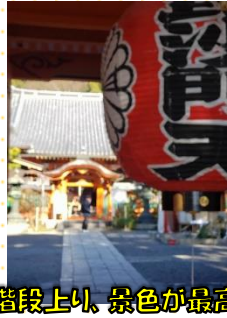
たくさん歩き階段上り、景色が最高でした!