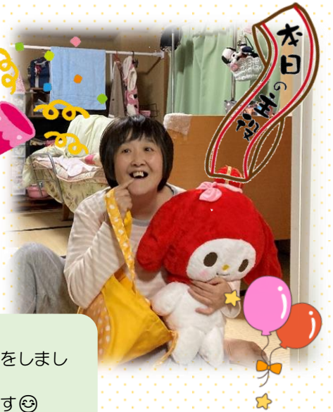
3月14日 春らしい可愛らしいケーキでお誕生日のお祝いをしました。 大好きなぬいぐるみのプレゼントで笑顔満開です ☺