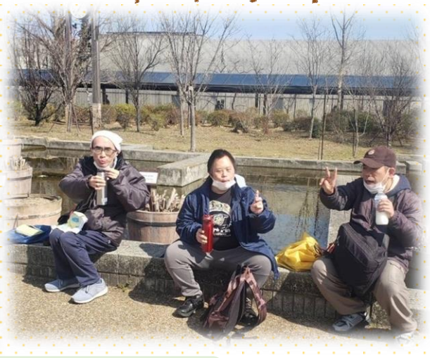
音羽ホームの皆さんで植物園へ ☺ まだ春の花は咲いていませんでしたが、気候も良く楽しく過ごしました。