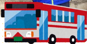
バスに乗ってお出かけ♪ 「今日はどこに行こうかな〜♪」