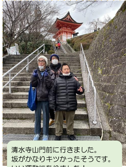
清水寺山門前に行きました。 坂がかなりキツかったそうです。 いい運動になりました！