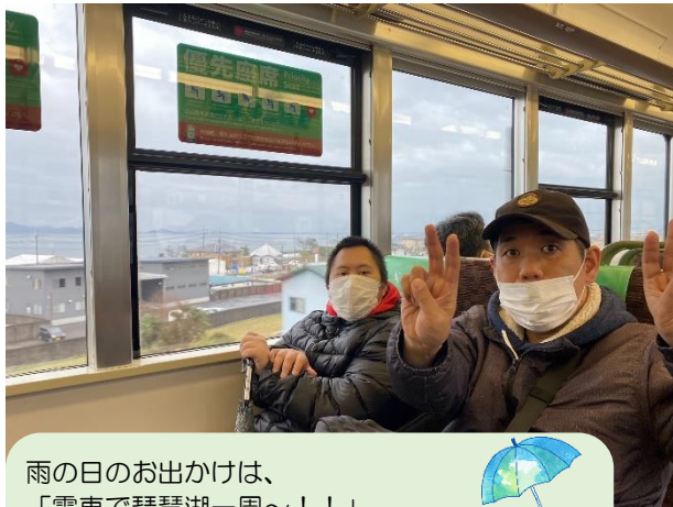
雨の日のお出かけは、 「電車で琵琶湖一周〜！！」 好きなお弁当を買って、いざ電車の旅へ〜 早々にお弁当が気になり、フライングされた ご利用様もおられました（笑）