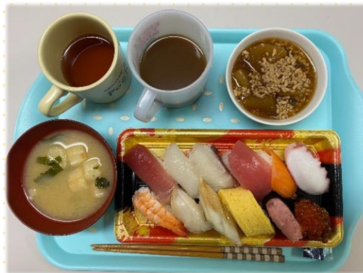
握り寿司 大根そぼろ煮 お味噌汁 コーヒー