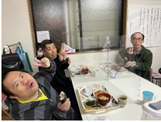
節分 恵方巻美味しくいただきました〜