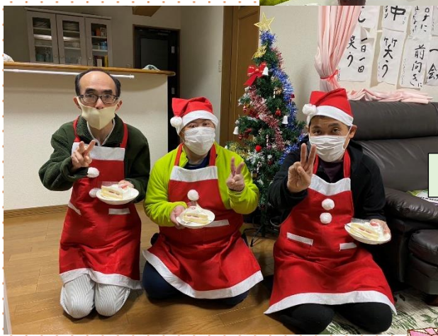
職員もサンタに大変身！