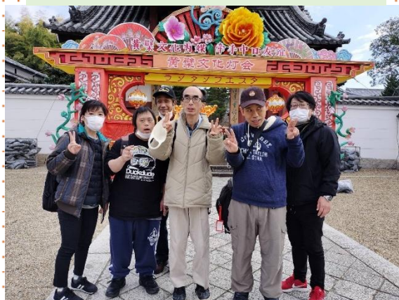
色鮮やかなランタンが沢山ありました！