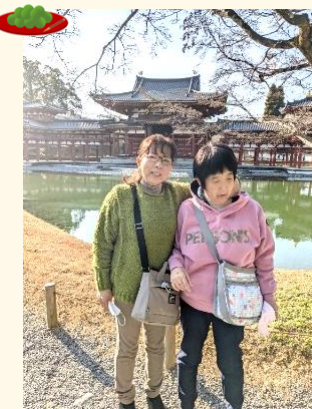
初詣は宇治の平等院へ