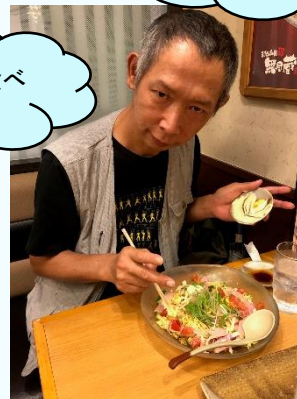
冷やし中華 食べ はじめました😊