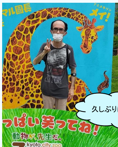
久しぶりに動物園へ！