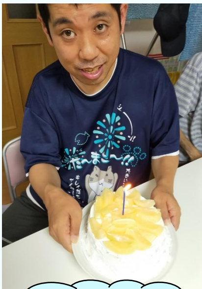
職員手作りのケーキで お誕生日会をしました♪