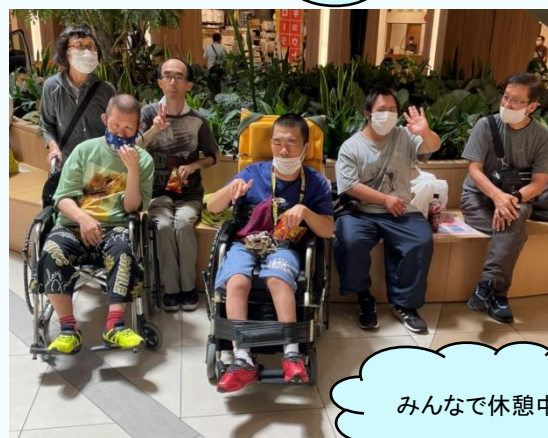
みんなで休憩中です