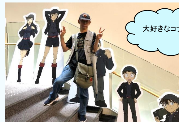
大好きなコナンと♪