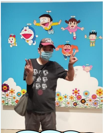
ドラえもん展へ。 たくさん作品がありました！