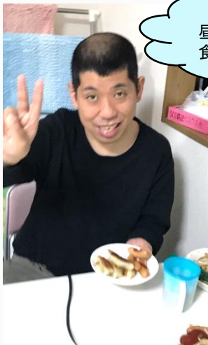
昼食にみんなで焼きそばを 食べました♪