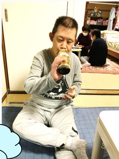
散歩から帰ってきて お茶で一服♪