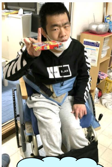
今日はホームで カードゲームに挑戦♪