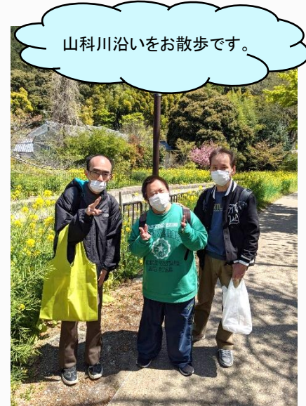
山科川沿いをお散歩です。