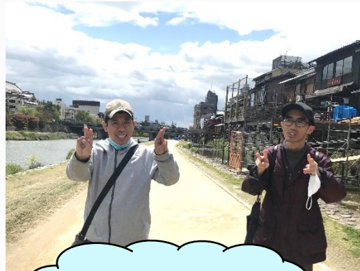
鴨川を散策。 たくさん歩きました！