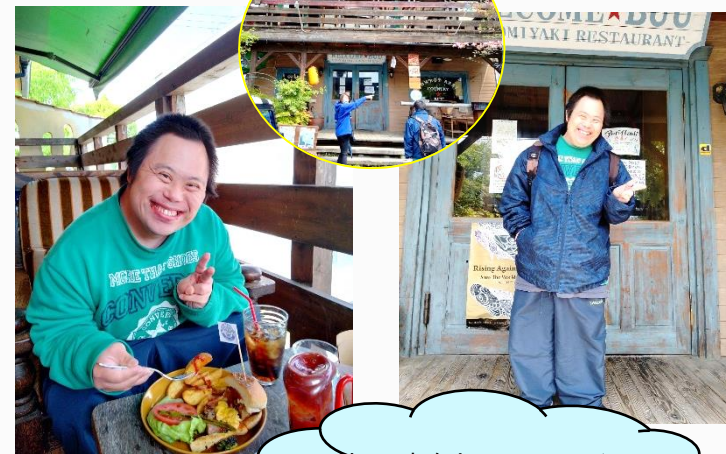
おしゃれなカフェでランチ♪ オープンテラス席で気分も↑