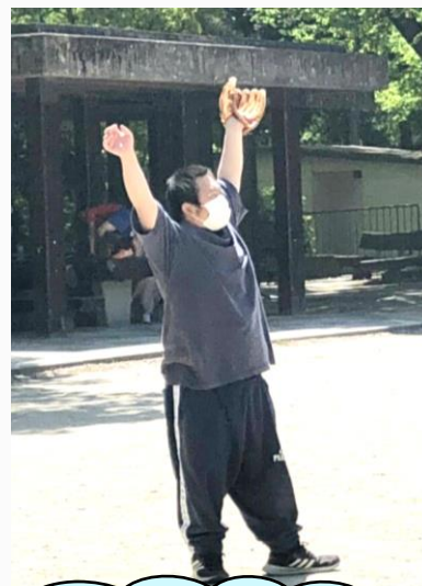
東野公園でキャッチボール！ たくさん動いて汗だくに☺