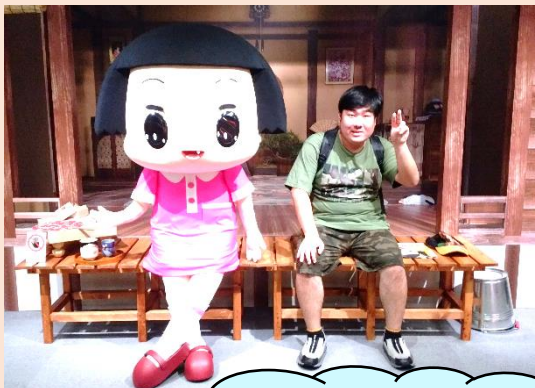
大丸で開催された チョコちゃんに叱られる！京都祭で チョコちゃんとツーショット♪