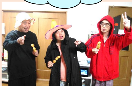
Happy Halloween! ちょっとだけ仮装しました♪ お菓子じゃなくて、お団子♪?