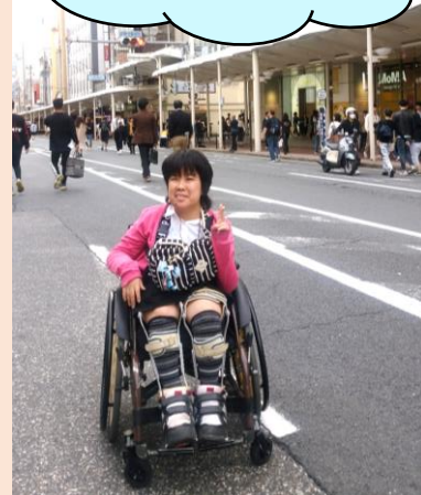
時代祭に遭遇！多くで見れなかつ たけど、ホコ天になった河原町通 でピース♪