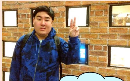
同志社大学まで遊びに 行きました。 気分は学生さん♪