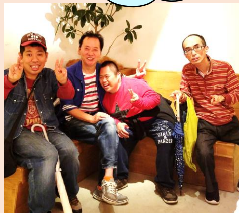
お出掛けの休憩中～ 募チーフにピタッ♪