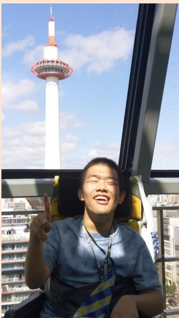
京都駅をブラブラ。 お天気が良かったから屋上で パンを食べたよ！