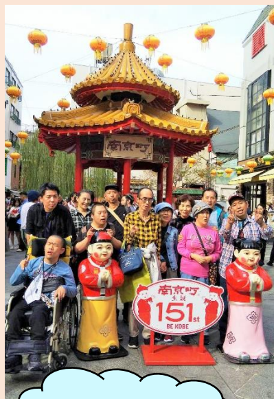
みんなで神戸の 南京町へ行きました！