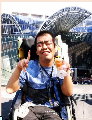
お目当てのガチャガチャを 一発ゲット！ヤッター！！