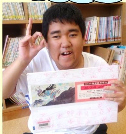
図書館にて。紙芝居も大好き！