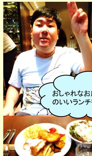
おしゃれなお店でバランスのいいランチをチョイス♪