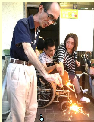
初めは怖かったけど持てるようになったよ！