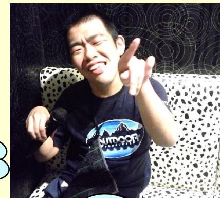
ゴージャスなカラオケ部屋で熱唱！