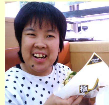
回転すし屋にもバーガーがある～美味しくいただきました♪笑顔がとってもかわいいね！